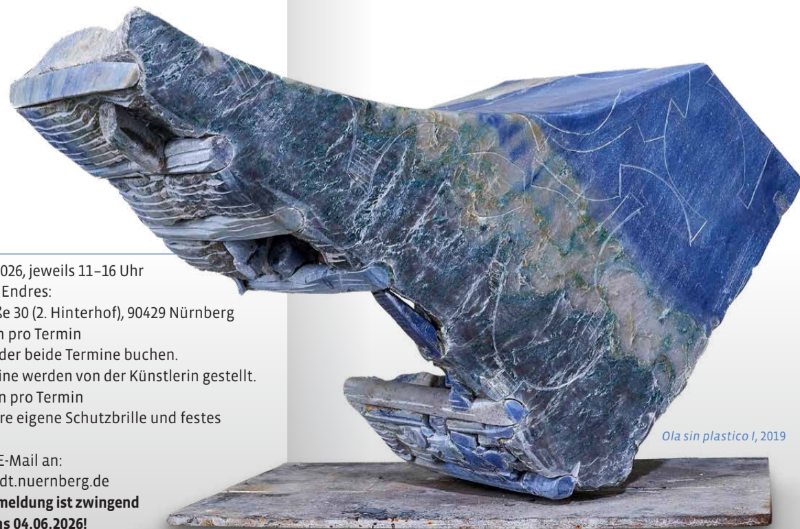
Ola sin plastico I, 2019

Termine Sa, 04.07. und 11.07.2026, jeweils 11–16 Uhr Ort Atelier von Claudia Endres: Mittlere Kanalstraße 30 (2. Hinterhof), 90429 Nürnberg Teilnahmegebühr 125 Euro pro Person pro Termin Sie können einen oder beide Termine buchen. Werkzeuge und Steine werden von der Künstlerin gestellt. Personenzahl Maximal 7 Personen pro Termin Bitte bringen Sie Ihre eigene Schutzbrille und festes Schuhwerk mit! Anmeldung Ausschließlich per E-Mail an: tucherschloss@stadt.nuernberg.de Die verbindliche Anmeldung ist zwingend nötig bis spätestens 04.06.2026!