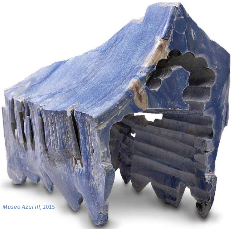
Museo Azul III, 2015