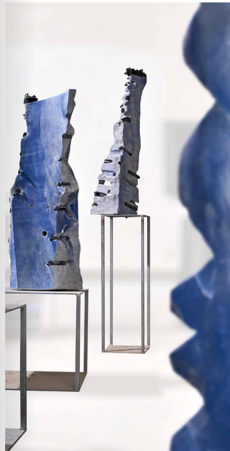
Links/left: Ola sin plastico II , 2020; rechts/right: Ola Azul II+III , 2023