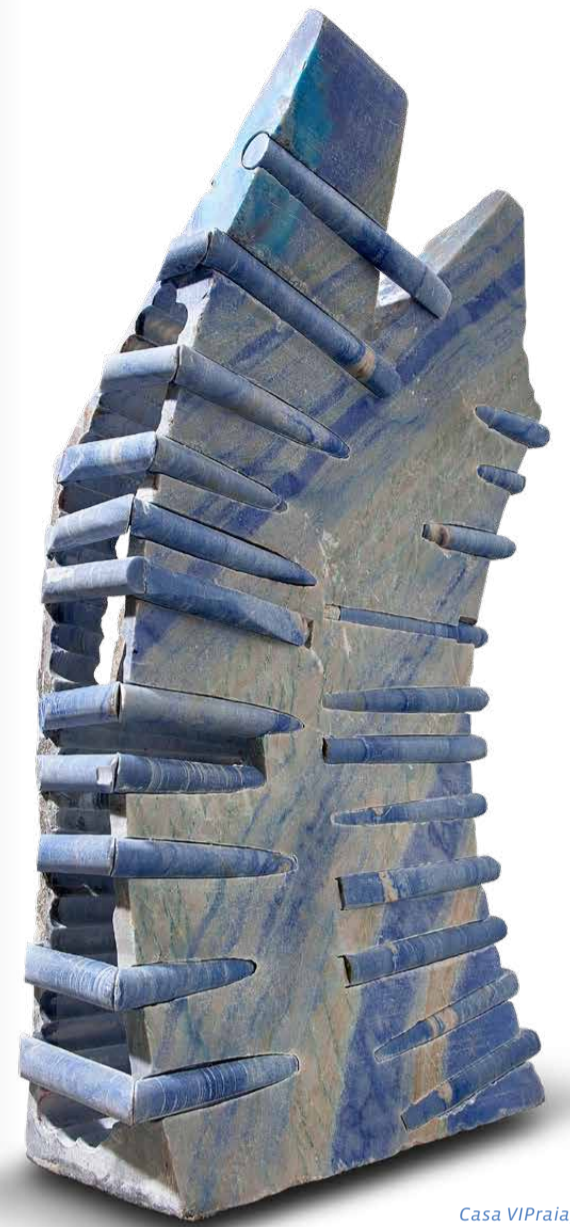
Casa VI Praia, 2016